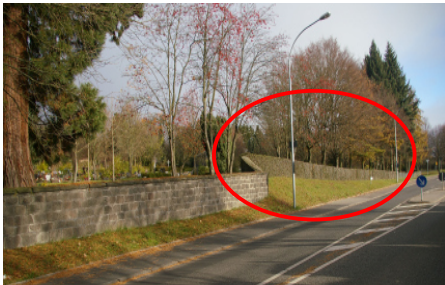
Großen-Buseck im Blick

Der Teil des Friedhofs , wo sie jetzt beerdigt sind, war ein kleiner Acker auf dem wir unsere Feldfrüchte noch mit der Hand anbauten.